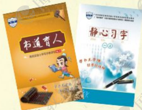
《静心习字》和《书道育人》系列